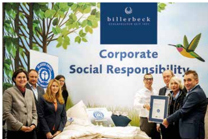
Foto: BLAUER ENGEL Urkundenverleihung im Rahmen Der Messe Heimtextil in Frankfurt am Main 2020.