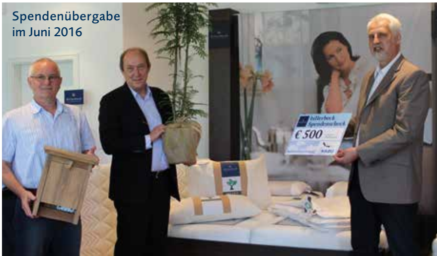
Spendenübergabe im Juni 2016