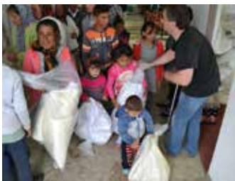
Oase des Lebens e.V. (Rumänien)

Seit über 25 Jahren betreut „Der bunte Kreis“ Familien mit chronisch, krebs- und schwerst kranken Kindern in der schwäbischen Region.